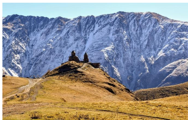
Gergeti 2400m n.p.m – Klasztor Cmind Sameba – kazbegi

Niezależnie jednak od niespodzianek, każda wyprawa, to naprawdę ogrom widoków i doznań i przeżyć. Masa, masa! kilometrów do przejechania. No tutaj mniej, bo stacjonujemy w Gudauri wg planu ☺, ale trochę godzin w samochodach i tak spędzimy, bo musimy dojechać. I zdjęcia też trzeba zrobić. I zjeść może. Może kawa? I wino może? ;- ) Na odcinku 140km z Tbilisi do Gudauri – naprawdę wiele może się wydarzyć i zachcieć ☺ A ten dzień jest przeznaczony właśnie na transfer ów. Zatem bez stresu – dnia nie wydłużymy!